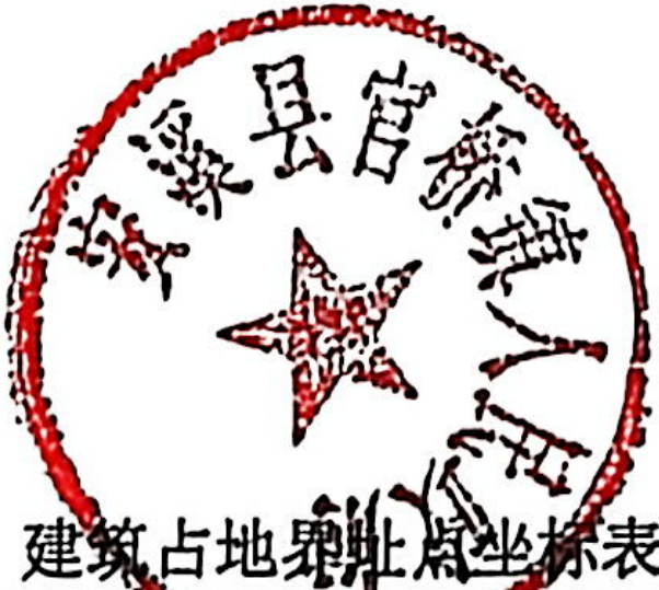
建筑占地界址点坐标表